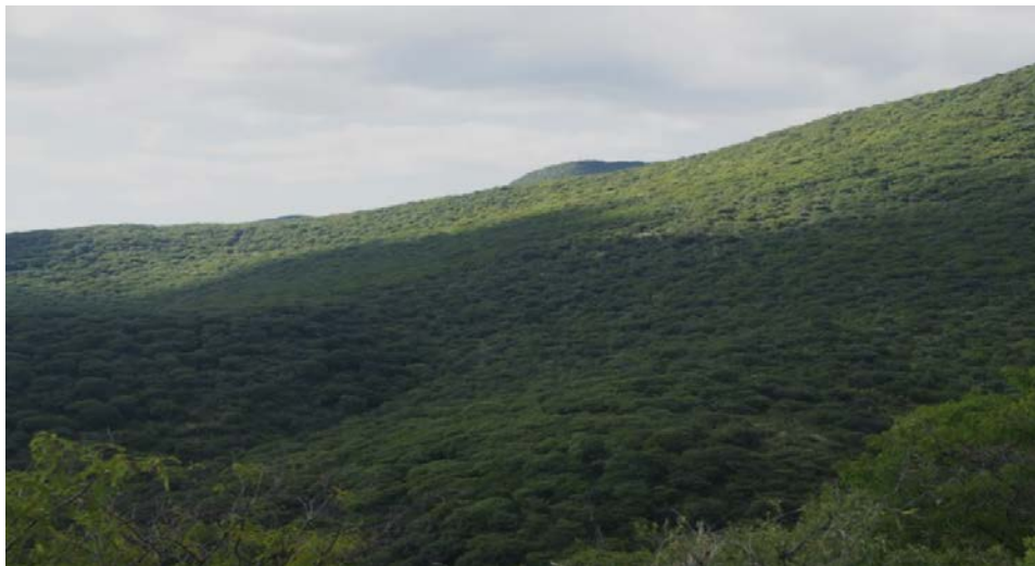
Figura 2. Panorámica de la propuesta de Área de Protección de Recursos Naturales Peña Colorada.

Finalmente, en concordancia con el Objetivo Prioritario 1 del Programa Sectorial de Medio Ambiente y Recursos Naturales 2020-2024 4 , la presente declaratoria contribuye a “Promover la conservación, protección, restauración y aprovechamiento sustentable de los ecosistemas y su biodiversidad con enfoque territorial y de derechos humanos, considerando las regiones bioculturales, a fin de mantener ecosistemas funcionales que son la base del bienestar de la población” .