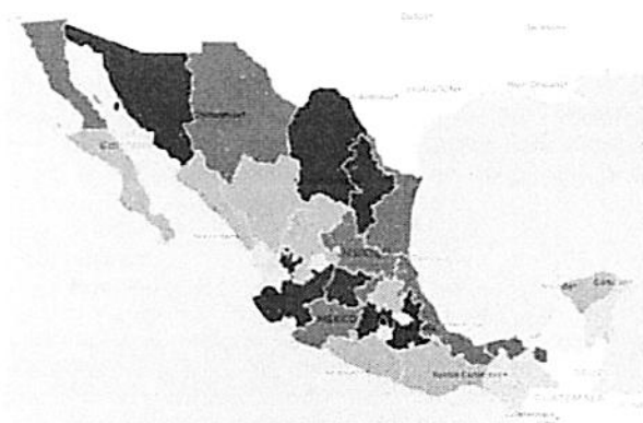
Tabla de casos por entidad federativa